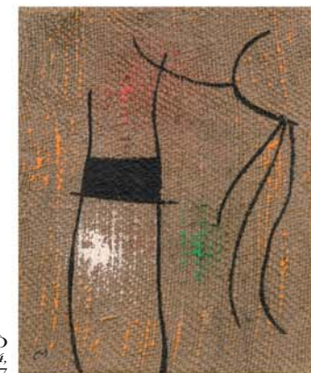
JOAN MIRÒ Mujer 4 , 1960, olio su tela, cm 22x27