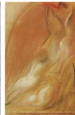
PIERO GUCCIONE La loggia dell'amore , 1986, pastelli su cartone, cm 19x29