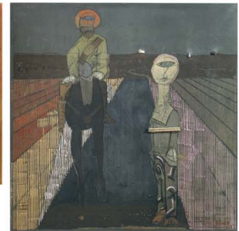
JOSÈ ORTEGA L'arrestato , 1968, tecnica mista su tela, cm 130x130