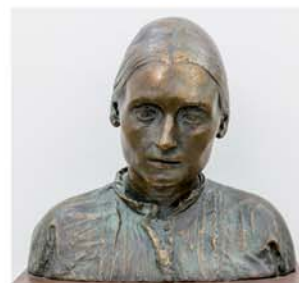
ANTONIO LOPEZ GARCIA Mari , 1962, bronzo, cm 35,5x22,8x38