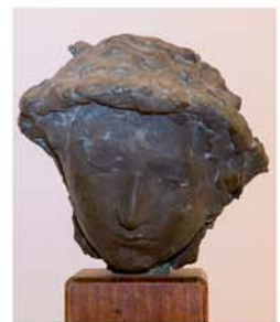
GIACOMO MANZÙ Testa di donna , 1939, bronzo, cm 25x26x39