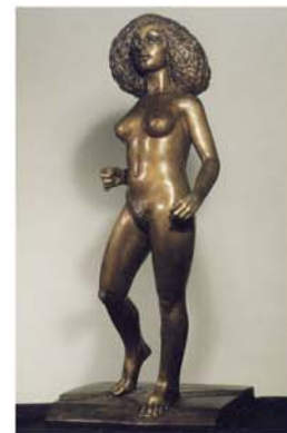
GIULIANO VANGI Ragazza nuda , 1986, bronzo, cm 86x43x41