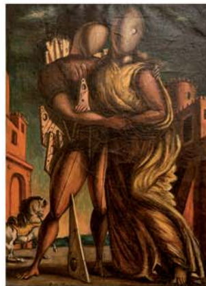
GIORGIO DE CHIRICO Ettore e Andromaca , 1935, olio su tela, cm 50x70

In copertina: Aligi Sassu, I ciclisti (part) , 1931, encausto su tela, cm 140x140