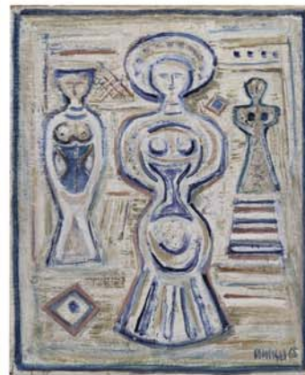
MASSIMO CAMPIGLI Figure , 1956, olio su tela, cm 48x56